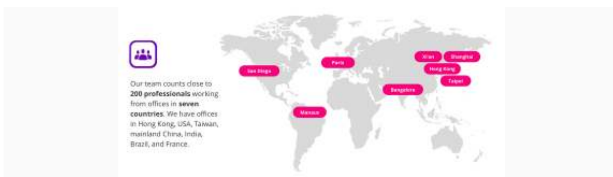
Рис. 1 – Офіси в різних країнах світу

За рік присутності на ринку телефонів Jiо зайняв 47%, і тенденція до зростання зберігається. За даними самої платформи, на руках у користувачів знаходиться 50 млн пристроїв (тобто приблизно в 2,5 рази менше, ніж зазначено в презентації, якщо перерахувати).