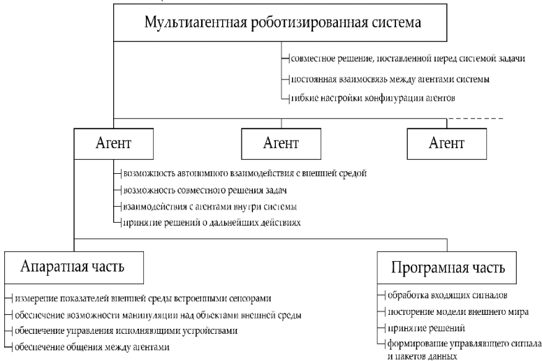
Рис. 2 – Структурная схема МАРС

МАРС можно рассматривать как один из вариантов реализации мультиагентных систем (МАС), и, следовательно, каждый робот-агент должен обладать следующими свойствами: активность, способность к организации и реализации действий; реактивность, способность воспринимать состояние среды; автономность и относительная независимость от окружающей среды; общительность, что вытекает из необходимости решать свои задачи совместно с другими агентами и обеспечивается развитыми протоколами коммуникации; целеустремленность, которая предусматривает наличие собственных источников мотивации.