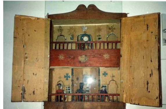
Могильовська батлейка (друга половина XIX ст.)

Мета статті – аналіз історіографії полеміки стосовно публікації Е. Ізопольського про український вертепний театр та формулювання гіпотези про час та соціокультурний осередок виникнення східноукраїнського вертепного театру.