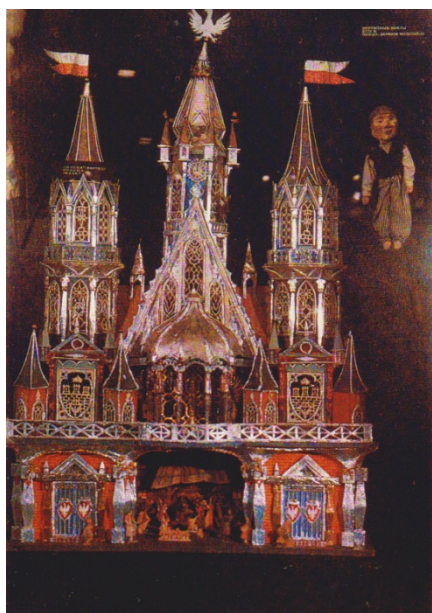
Одноповерхова шопка XVIII ст.

мах та будівлях ніколи не пишеться "Року Христового", а звичайно "Року божого», а "збудовані" в руській мові вже й зовсім неможливе» [35, 199]. І.Я. Франко робить суворий вирок: «Думаю, що сих уваг досить, щоб раз на все вичеркнути фантазії Ізопольського з ряду матеріалів до історії українського вертепу» [35, 201]. Аргументи вченого виявились на стільки переконливими, що під їхнім впливом дослідники змінювали (як, наприклад, В.М. Перетц [26, 5-17]) або формували свої концепції про час народження вертепу. М.С. Возняк [8, с. 148], О.І. Білецький [5, 93-94], В.І. Чичеров [38, 415], М.С. Грицай [11, 16-17], Н.М. Андріанова [1, 5], – усі вони датували появу вертепу другою половиною XVII ст. та, навіть, початком XVIII ст.