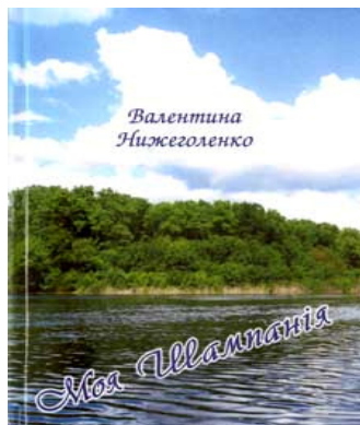
Рис. 3. Збірка «Моя Шампанія»

Ролюбилися дніпрянцям твори і «Двічі народжені», і «Незабутній», і «Благородний», і «Босоногі мрійники», і «Катруся», і «Моя Шампанія» (Рисунок 3) тощо. У них – на тлі історичних подій виписуються долі багатьох людей, які стверджуються у цьому житті, надіються, розчаровуються і перемагають. Для кожної людини є найсвятіше місце на землі, те місце, де вона колись народилася і виросла. Для Валентини Михайлівни – це улюблене село Дніпряни, її маленька батьківщина.