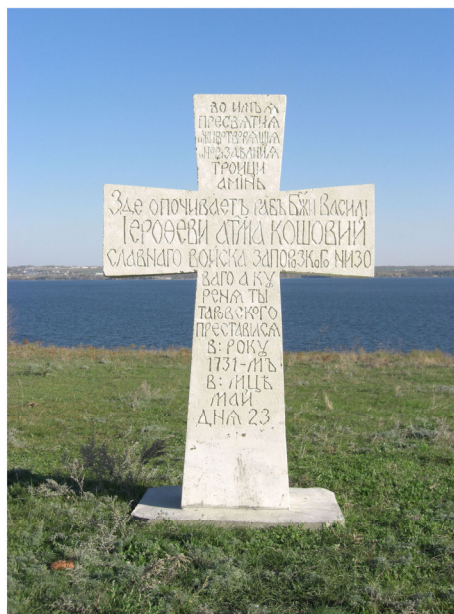
Рис.5. Реконструйований хрест кошового отамана Василя Єрофеєва. Встановлений 2008 р.