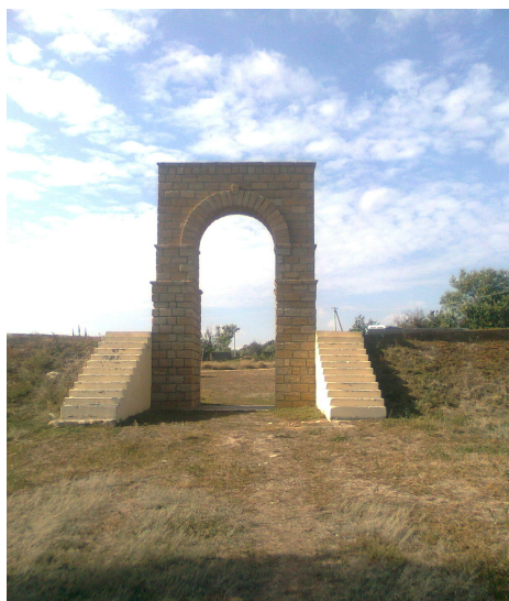
Рис.7. Реконструйовані ворота при в'їзді в Кам'янську Січ

Висновки. Вже перші дослідження Кам'янської Січі стали результативними. Так, було уточнено планування Січі. Виділено залізоплавильні і залізообробні комплекси, які дозволяють відтворювати технологічні процеси видобування і обробки заліза. Вивчені житлові комплекси дають змогу простежити розміри і планування куренів, а також відтворити деякі їх конструктивні особливості.