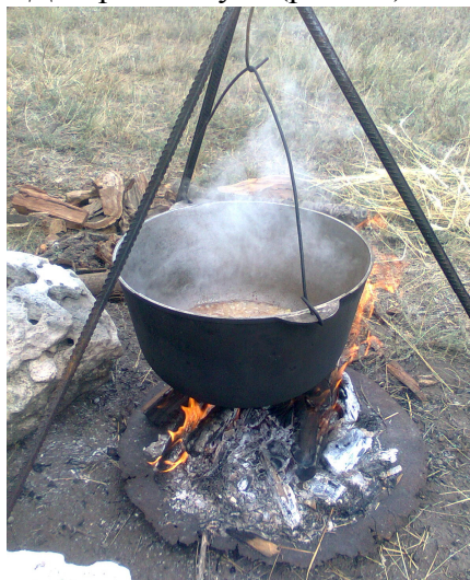
Рис.10. Козацький куліш