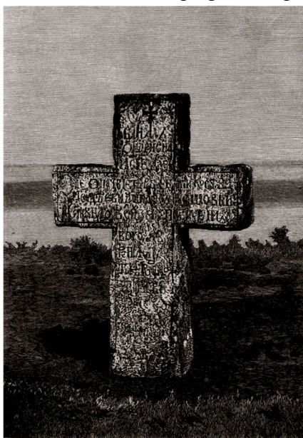
Рис.4. Хрест на могилі Кості Гордієнка