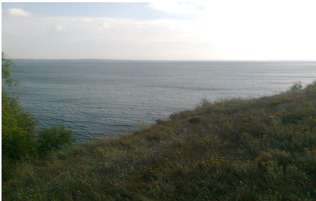
Рис.11. Краєвид Дніпра