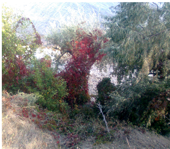
Рис. 1. Мальовничі береги Дніпра

місцями порослі величезними віковими дубами (рис.1). Через усе це по берегах балки та біля гирла можна було побачити такі химерні гроти (рис.2), оточені надзвичайно густою й різноманітною рослинністю, яких не витворила б і найвигадливіша уява людини. Недаремно ця місцевість так захоплювала й захоплює у наш час різних туристів і мандрівників по низу Дніпра. «Тут, – пише Афанасьєв-Чужбинський, – у цьому тихому куточку, серед цих суворих скель любитель природи просидів би кілька годин, поринувши в безтурботні думи і, можливо, надовго зберіг би в пам'яті оригінальний дикий пейзаж із мандрівок пониззям Дніпровським. А якщо цей мандрівник малорос, думи його намагатимуться осягнути сенс однієї сторінки російської історії».