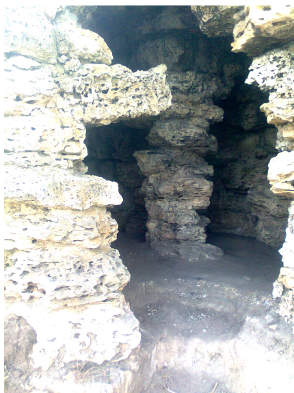
Рис.2. Химерні гроти

З руїн, що збереглися до нашого часу, видно, що Кам'янська Січ займала невеликий куток між правим берегом Козацького Річища й лівим берегом Кам'янки, вище гирла Кам'янки сажнів на 100, й мала форму неправильного чотирикутника, витягнутого з півночі на південь, з вершиною на півдні. Величина цієї Січі у чотирьох напрямках визначається так: 115 сажнів зі сходу, 66 сажнів з півночі, 123 сажні з заходу, 36 сажнів з півдня. Посередині Січі, з півночі на південь, розташована площа завширшки в шість сажнів на півночі й три на півдні, по обидва боки площі тягнуться курені й скарбниці в кількості 40; один ряд цих куренів тягнеться вздовж Козацького Річища з виходами на захід, а три ряди йдуть від степу до Кам'янки з виходами на схід та захід. Між останніми трьома рядами, як і між першими, з півночі на південь простягається площа таких самих розмірів, як і перша. Кожен із куренів має 21 аршин довжини й 12 ширини. Слідів від церкви не лишилося, та й не могло лишитися, оскільки як у Кам'янській, так і в Олешків-