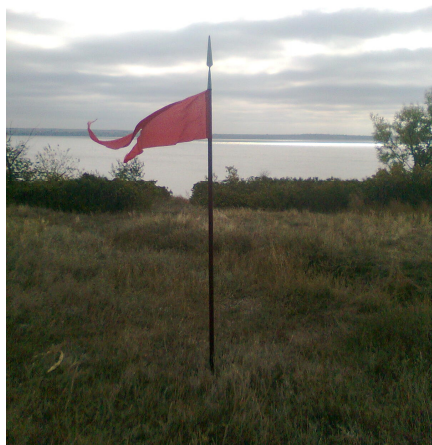
Рис.9.Символ козацької слави

Молодь із задоволенням поринає в ті далекі часи: знайомиться з козацькими звичаями, символікою (рис.9.), куштує козацький куліш (рис.10.), вдивляються в неосяжну далечинь сивого Дніпра-Славути (рис.11.).