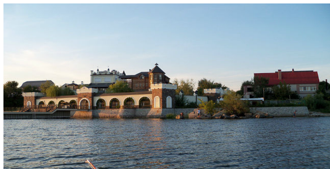
Рис.4 Новий Антонівський причал на р. Дніпро

На пам'ятнику встановлена меморіальна дошка з прізвищами похованих солдат. [3]