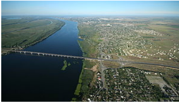
Рис.2 Сучасний вид с. Антонівка

Схожий хрест на козацький, встановлений на могилі з роду Гаркуш в Антонівці його синами, про що свідчить напис на цьому хресті. Про козацьке походження небіжчика вказує і сама форма та розмір насипаної могили, що значно перевищує за розміром інші могили.