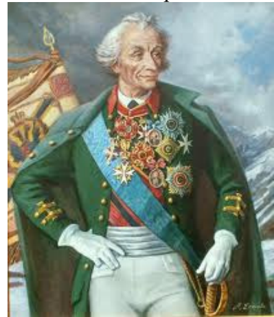
Рис.3 О.В. Суворов

Олександр Суворов. 1787 року до Херсона приїхав О. В. Суворов. Під його командуванням війська Херсонського корпусу повинні були обороняти Херсонсько-Кінбурнський район. О. В. Суворов оглянув район майбутніх військових дій, в тому числі Херсонську фортецю, підступи до міста та вжив заходи щодо їх укріплення. Досвідчений полководець та стратег Суворов підготував фортецю до оборонних дій і отримав перемогу над турками у битві під Кінбурном, за що був нагороджений орденом Андрія Первозванного. Після війни, в 1792 році О. В. Суворов був призначений начальником військ Катеринославського намісництва. Свою штаб-квартиру О. В. Суворов розмістив в Херсоні та продовжував удосконалення укріплень цього стратегічного району. В кінці 1794 р. Суворов був переведений в інший район Російської імперії.