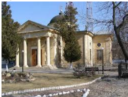
Рис.8 Катеринівський собор