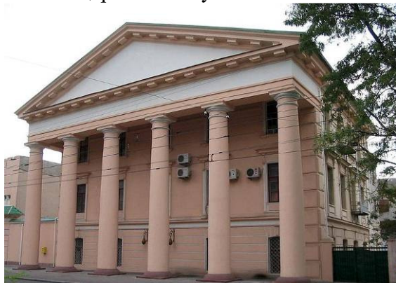
Рис. 7 Херсонський арсенал

Далі по маршруту Дім офіцерів і стадіон «Спартак». Недалеко іще один стадіон – «Кристал» на 25 тис. місць. Навпроти нього знаходиться будівля кіноконцертного залу «Ювілейний» на 1700 місць.