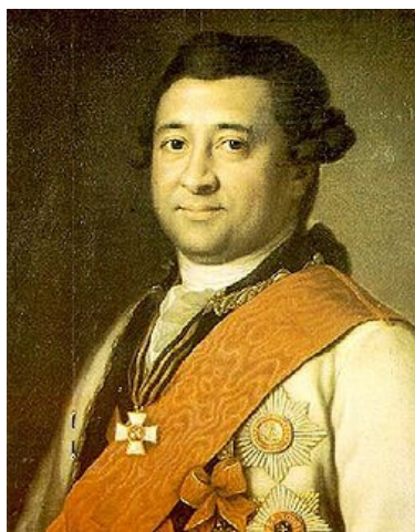
Рис.2 Один із заставників і будівників Херсона генерал І. А. Ганнібал

Іван Ганнібал. 25 липня 1778 року головним будівничим «новозаводимого на Дніпре при урочище Александровском Шанце города Херсона с надлежащими укреплениями, и в оном верфи и адмиралтейства» був призначений генерал-цейхмейстер І. А. Ганнібал. Через декілька місяців він по-відомляв, що 19 жовтня закладено фортецю і місто, а також два корабельні еллінга.