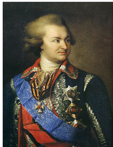
Рис.1. Засновник міста Херсона – Г. О. Потьомкін.

18 червня 1778 Катерина II видала наказ Новоросійському генерал-губернатору Г. О. Потьомкіну ((13 (24) вересня 1739, Чижово — †5 (16) жовтня 1791) — російський державний і військовий діяч, дипломат, генерал-фельдмаршал (з 1784), князь, прозваний запорізькими козаками прізвиськом Гриць Нечеса. ), в якому наказувала знайти в гирлі Дніпра місце для будівництва гавані і верфі і найменувати це місце Херсоном. Так було засновано місто, назване по імені давньогрецької колонії Херсонес (в середні віки - Херсон), яке відіграло у свій час значну роль в історичних долях Північного Причорномор'я: «Место сие повеливаем называть Херсоном».