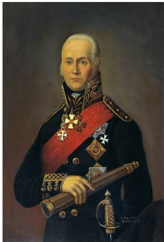
Рис.4 Ф. Ф. Ушаков.

На початку вулиці, яка носить ім'я прославленого воєначальника, встановлено пам'ятний бюст, біля якого завжди багато туристів.