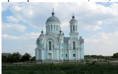
Рис.3 Церква Св. Ольги в с. Токарівка

Одразу за с.Тягинка повертаємо праворуч. Звивиста ґрунтова дорога тягнеться до острова Велике Городище, що за пару кілометрів від села. «Маяком», що веде подорожувальника, є красивий пам'ятник-колона, з якого височіє скульптура покровителя православного воїнства Архистратига Михайла. (Рис.5)