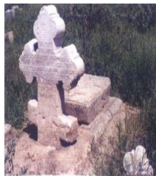
Рис. 2 Козацьке поховання поч. XIX ст. м. Херсон

Туристичний автобус під'їжджає до с. Токарівка. Назва села походить від прізвища перших господарів. Засноване 27 червня 1780 р. польським хорунжим Антоном Токаревським. Але ще в катерининські часи він програв маєток сім'ї Ерделі, які володіли ним до радянських часів. У с.Токарівці по сьогодні зберігся головний будинок маєтку Ерделі і монументальна водонапірна башта кінця XVIII ст. Обидві споруди в задовільному стані, лише в підвалі будинку, до якого відкрито вхід, назбиралося чимало сміття. А над усім селом височіє найкрасивіша споруда селища – церква Святої княгині Ольги (Рис.3). Її зведено у 1994-2001 роках за проектом херсонського архітектора Михайла Вустянського, а побудував підприємець Костянтин Довгань. Колокол церкви відлит на Нововолинському ливарному заводі. Восьмиколонна башта найбільш монументальна з усього архітектурного ансамблю. Цоколь її обмурований