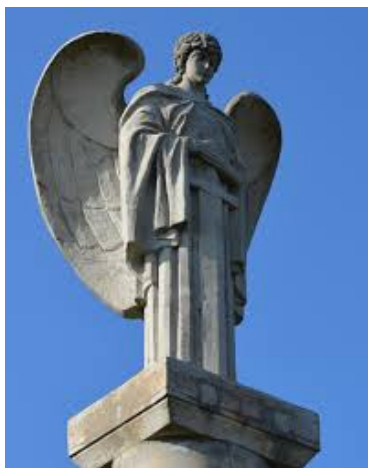
Рис. 5 Пам'ятник «Козацької слави». с.Тягинка

При виїзді з Тягинки сріблястими куполами притягує погляд православна церква, зведена на місці масового поховання жертв Голодомору 1932-1933 років (Рис.6). За пару кілометрів від неї – ще один пам'ятник Богданові Хмельницькому.