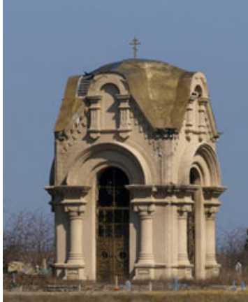
Рис. 9 Меморіальна часовня на честь захисників Севастополя

У 1711 р. за наказом Петра I Кам'янська Січ була зруйнована. [3]