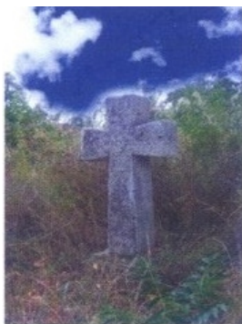
Рис. 1 Козацьке поховання поч. XIX ст.