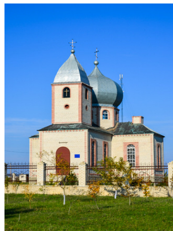
Рис. 6 Місце масового поховань жертв голодомору

А наш шлях йде далі. У балці Бургунка, зліва від дороги, зберігся прекрасний трьох арочний міст, зведений напередодні мандрівки Катерини II на Південь.