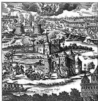
Рис. 7 Турецька фортеця Газі-Керман (м.Берислав)