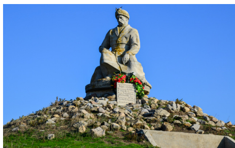
Рис. 4 Пам'ятник Богдану Хмельницькому

Меморіал встановлено 1992 року на честь 500-ліття українського козацтва. «1492 року українські козаки біля Тягині дали перший бій туркам», – свідчить один із написів біля підніжжя колони. За даними істориків, на цьому острові ще в XIV ст. з'явився замок. «Існує поширена думка, що в 1491 році кримський хан Менглі-Гірей дав йому назву Тягин. Разом з іншими фортецями Нижнього Дніпра Тягин став одним із опорних пунктів під час набігів кримсько-турецьких орд на українські землі. Однак уже в 1492 році козаки з Києва і Черкас захопили під Тягином турецький корабель. З цією подією пов'язують першу документовану згадку про українське козацтво. У наступних століттях