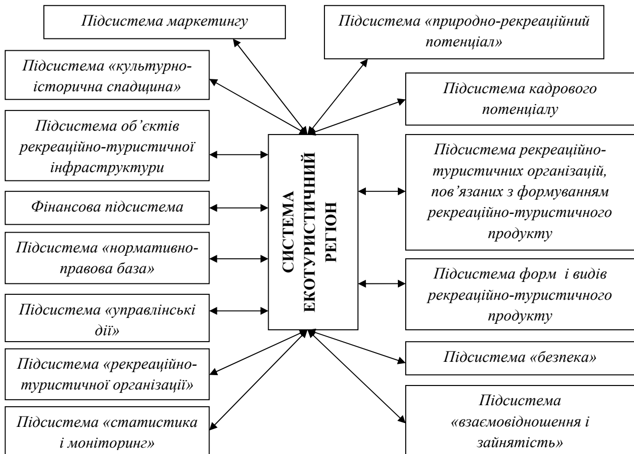
Рис. 1. Підсистеми єдиної комплексної системи екотуристичного регіону

Основні напрями та завдання формування і реалізації конкурентоспроможного екопродукту в туристичному підприємстві зведено в таблицю.